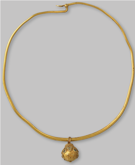
Рис.1. Гривна ДМ -1635.

В археологической коллекции Музея исторических драгоценностей Украины находится немало вещей, которые происходят из дореволюционных раскопок и частных собраний. В силу исторических обстоятельств “легенда” таких предметов неизвестна, что затрудняет их исследование и атрибуцию. К таким экспонатам относится небольшая античная шейная гривна с шаровидной подвеской (ДМ-1635), происходящая, вероятно, из дореволюционных раскопок (рис. 1).