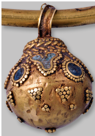
Рис. 3. Подвес.

Аналогов подвеске найти не удалось (рис. 3). Декор подобного типа известен (обилие треугольников из зерни, зернь вокруг кастов со вставками, косичка по периметру) в вещах позднесарматского времени — III–IV вв. н.э., однако для них абсолютно нетипичны сердцевидные касты, заполненные сине-зеленой эмалью. Да и сами вещи, украшенные подобным образом, гораздо больше и массивнее (зачастую это элементы поясной гарнитуры и конского снаряжения). Сердцевидный же орнамент, заполненный эмалью, был широко распространен в декоре украшений эллинистического времени. Сочетание их между собой в паспортных находках неизвестно.